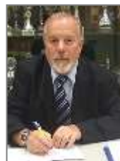
C.Verdel Haarlemsche Damclub

Hiermede vindt u de uitslagen en de eindstanden van het Sneldamkampioenschap van Noord-Holland 2022. Helaas was er weinig opkomst door allerlei redenen.